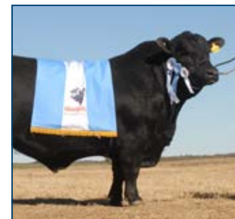
Lonquimay, su premiado padre. GCM Nacional 2012.