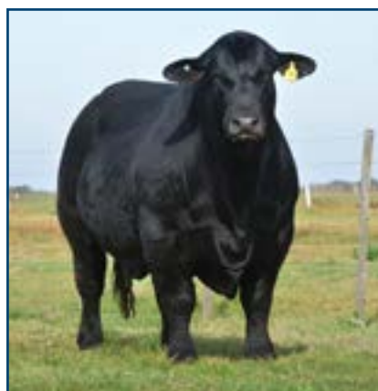
Impponente frente de Payanquen.